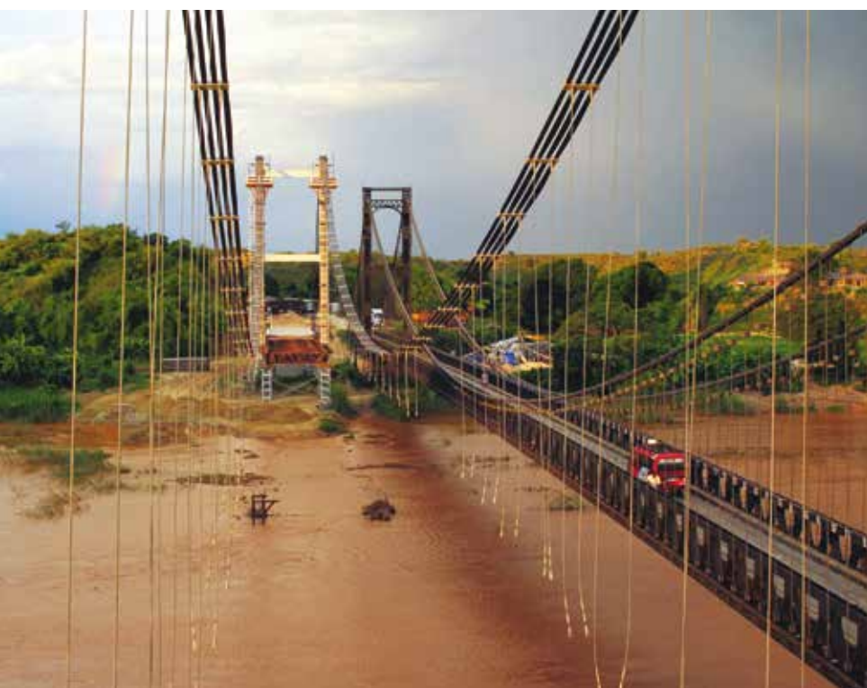
1. I due ponti sospesi di Kamoro in Madagascar

Il nuovo ponte di Kamoro in fase di ultimazione