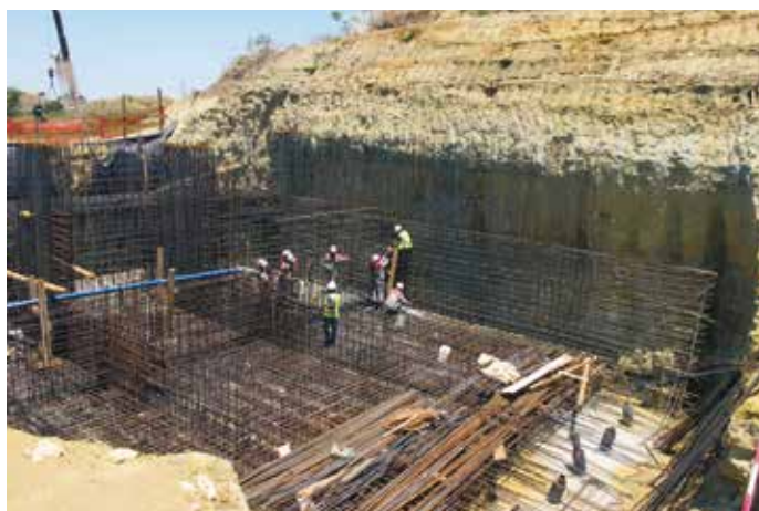
4. L'ancoraggio C5

la soluzione scatolare in acciaio che non richiedeva di cassare in quota questi elementi, ma solo una buona precisione nel posizionamento delle contropiastre annegate nel getto dei fusti. Considerato infatti che tutta la carpenteria metallica è stata fabbricata in Europa, i trasversi sono stati consegnati in cantiere insieme all'impalcato quando le torri erano completate da mesi e si era già in fase di posa in opera dei cavi.