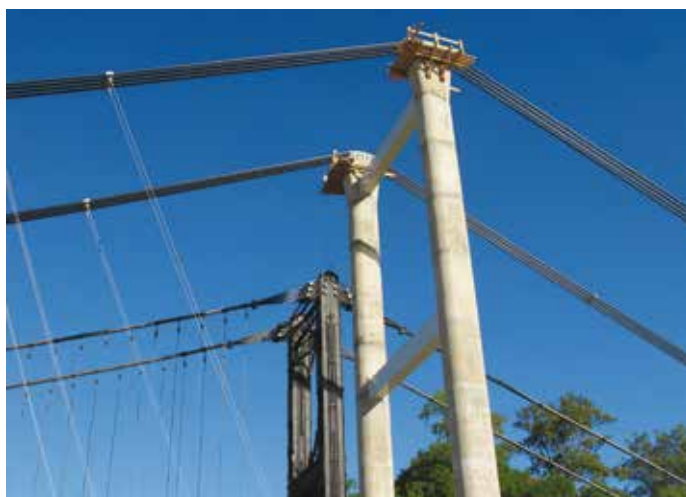
5. Le torri in calcestruzzo

Il problema di queste selle scorrevoli è che vanno ricentrate con un buon tempismo ed un sistema efficace. Il tempismo è impor-