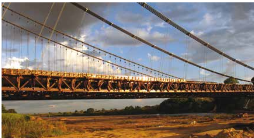
8. La configurazione radiale dei pendini

Terminato lo smontaggio degli appoggi provvisori si è proceduto a posare in opera la soletta prefabbricata. Questa pesa circa quattro volte la carpenteria metallica dell'impalcato e quindi la sua posa in opera ha portato un forte impegno flessionale dell'impalcato che si deformava sotto il peso non uniforme delle solette man mano che le stesse venivano poggiate sulla carpenteria. In questo caso si è dovuto quindi procedere in maniera quasi simmetrica man mano che l'impalcato passava da un peso di 1 t/m di carpenteria a 5 t/m con la posa degli elementi di soletta.