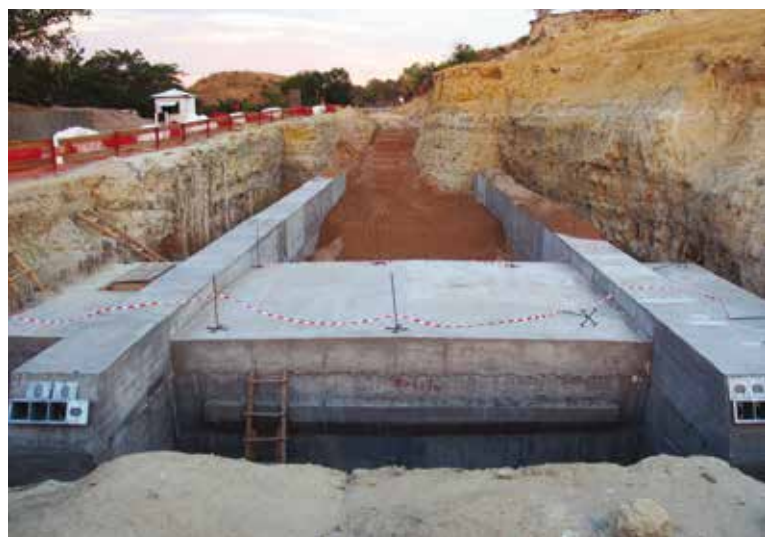
3. L'ancoraggio M0

Per l'ancoraggio C5, lato Mahajanga, il massivo è stato invece ancorato agli strati più consistente di arenaria posta a circa 10 m sotto il piano di scavo mediante un centinaio di micropali perforati in obliquo.