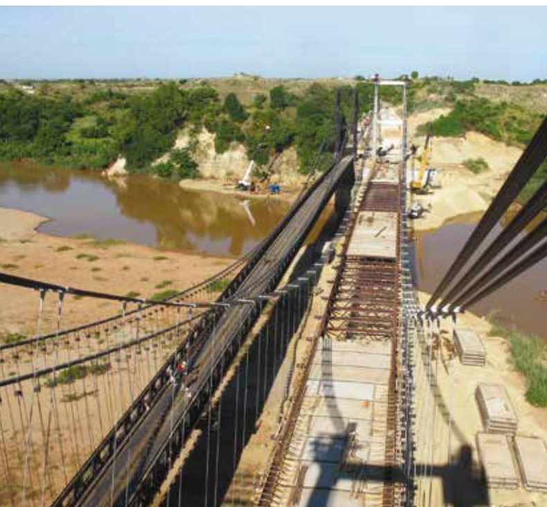
10. La fase di posa in opera della soletta prefabbricata