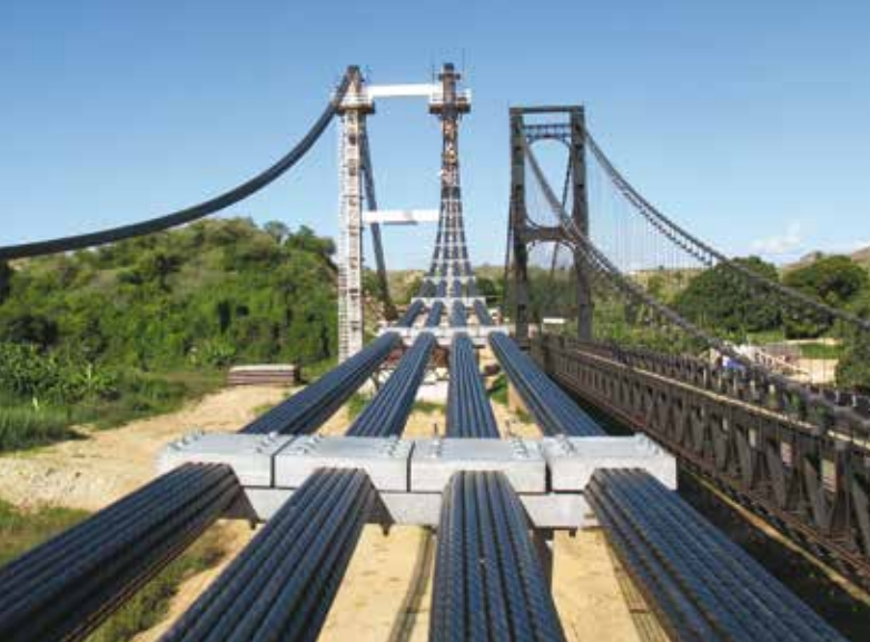
7. Un dettaglio di cavi e collari

installazione è infatti terribilmente semplificata se si riesce a tenerli entro un peso manovrabile a mano. Da notare come questi collari permettano la rimozione di un cavo alla volta, caratteristica irrinunciabile in quanto consente la sostituzione del sistema di sospensione un cavo alla volta, senza necessità di prevedere un sistema ausiliario di sostentamento dell'impalcato.