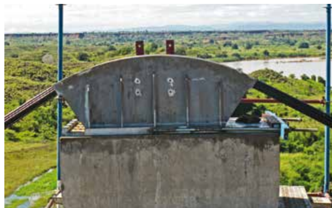
6. Le selle scorrevoli in acciaio

Dopo alcuni tentativi falliti con altri sistemi, finalmente sono state installate queste barre e si è iniziato a tirare. Molto divertente il momento in cui si è vinto l'attrito statico e i piloni sono partiti all'indietro rilasciando parte dell'energia elastica accumulata. Un po' come ad inizio spinta nei vari di punta, solo che qui si stava in quota a 30 m circa e i fusti hanno iniziato a camminare da soli tra lo stupore di molti dei presenti. Sono seguite alcune tolemaiche quanto comiche discussioni per convincere la gran parte degli astanti che erano andati indietro i piloni e non avanti le selle, discussioni a cui si è potuto porre la parola fine solo dopo misure topografiche decimetriche (!).